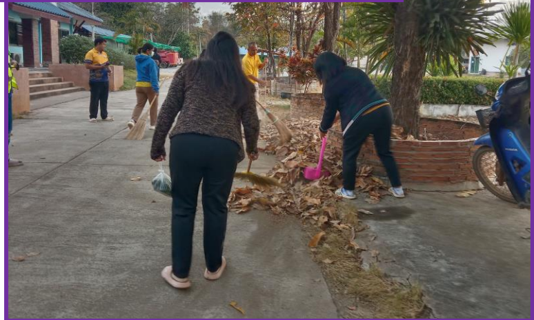
ร่วมกันทำกิจกรรม Big Cleaning Day